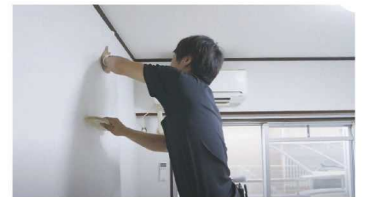
アパートでの内装施工の様子

清掃だけでは対処が難しくなる場面もあり、内装工事も手掛けるようになりました。ハウスクリーニング専門、内装業専門という会社もありますが、建物内の環境を改善する際、清掃だけ、内装施工だけでは叶えられないこともあります。当社では両方をハイブリッドして、各分野の有資格者が両方の目線から見て、お客様により良い提案ができる体制を整えています。