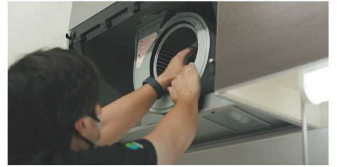
ハウスクリーニング（キッチンの換気機器の清掃）

エアコンクリーニングは、一般家庭向けの壁かけエアコンから、業務用の天井エアコンまで対応しており個人・法人を問わず需要が大きく、年間約 2,000 台の依頼をいただいています。空気中の細かいホコリはエアコンのフィルターを通して内部に付着すると、カビやダニなどが増殖して室内の空気を汚染する原因になってしまいます。汚れによって本来の性能を発揮できず、電気代が多くかかるという検証結果も出ているので、使用頻度が増える季節の前のクリーニングがおすすめです。一般家庭からは台所・お風呂など水回りの清掃依頼も多く入ります。タバコやトイレなど、生活環境で発生する不快なおいを取り除くことができるオゾン除菌脱臭サービスも実施しています。