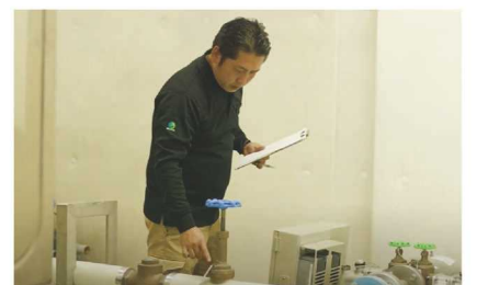
貯水槽点検の様子

また、マンションやビル等に設置されているような貯水槽の清掃や、設備点検、水質検査などもしており、安全に水を使ってもらえるようにしています。