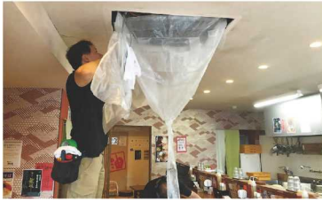
エアコンクリーニングの様子

エアコンクリーニングは、一般家庭向けの壁かけエアコンから、業務用の天井エアコンまで対応しており個人・法人を問わず需要が大きく、年間約 2,000 台の依頼をいただいています。空気中の細かいホコリはエアコンのフィルターを通して内部に付着すると、カビやダニなどが増殖して室内の空気を汚染する原因になってしまいます。汚れによって本来の性能を発揮できず、電気代が多くかかるという検証結果も出ているので、使用頻度が増える季節の前のクリーニングがおすすめです。一般家庭からは台所・お風呂など水回りの清掃依頼も多く入ります。タバコやトイレなど、生活環境で発生する不快なおいを取り除くことができるオゾン除菌脱臭サービスも実施しています。