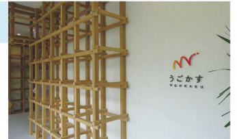
運動のエリア「うごかす」

施設内では「シーカーズ」という仮想通貨を導入しており、おやつ、ものづくりに使う材料などを購入できます。おやつショップの店員や、お掃除、ペーパークラフトのような遊びながら学べる課題シートに取り組むことで稼ぐこともでき、遊びながら金銭感覚を身に着けられるようになっています。