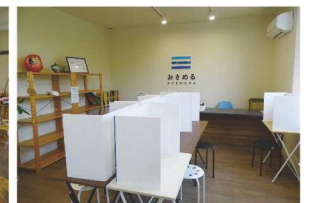
学習のエリア「おさめる」