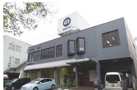
改修した社屋の外観