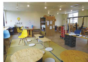
表現のエリア「うみだす」