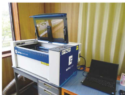
数十秒で同時に複数個への彫刻が可能

ネット販売にも対応する必要があるだろうと、約5年前に「ギフトギャラリー SATO 楽天市場店」を出店しました。オンラインで注文を受け、メダルや楯、トロフィーなどに、ご希望の文字を自社で彫刻して発送しています。