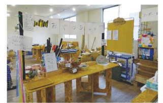
施設内通貨で買い物できる おやつショップ