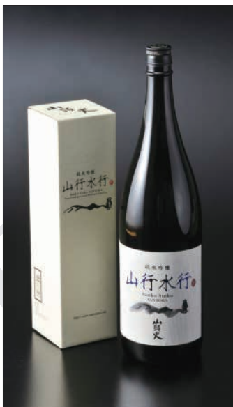
Re: 維新ブランド新登録商品「山行水行」

本当に美味しいお酒は翌日に残りません。お酒は「百薬の長」とも言われておりますし、楽しいときや嬉しいときに欠かせないものです。適度に美味しく飲んでいただき、弊社のお酒を末永く応援していただけたらと思います。