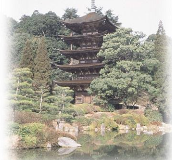
国宝・瑠璃光寺五重塔