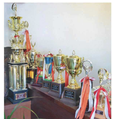
理容競技大会等での受賞トロフィーの数々

最近、東京など都市部では、お客様にゆっくりくつろいで頂ける個室理容室が増えています。当店のコンセプトにも合っていますし、将来的にはそういった店舗展開も考えていきたいと思っています。