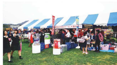
田布施まつりにも出店

事業を維持・拡大していくために、マンパワーは欠かせません。魅力ある職場として選んでもらい、長く勤めてもらうためにも経営者として雇用・育成に力を入れているところです。イキイキと働くスタッフが会社を元気にし、お客様の健康な毎日をサポートすることで地域を元気にしていく。これからも私たちは健康をキーワードに、お客様に一番近い存在として愛され信頼される企業を目指して頑張っていきます。