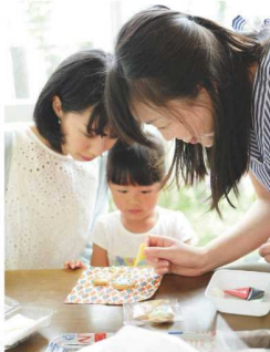
子供も楽しめます

私は大学卒業後看護師として勤務しましたが、結婚・出産を機に退職。それまで料理やお菓子作りは余り得意ではなく、子供の喜ぶ顔に励まされて頑張るようになりました。アイシングクッキーもお誕生日ケーキの飾りがスタートで、やり始めると極めたくなる性格も手伝って、独学でしたが徐々にレパートリーを拡大。知人にプレゼントしても反応が良く、まだ山口市内に専門店が無かったので、これは事業になるかと思えました。