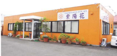
国道沿いで目立つ外観

リハビリ特化型では、従来のデイサービスで提供している食事や入浴サービスを行いません。そのかわり、所要時間が半日と短時間で、利用料金も抑えることができます。当事業所では2名の理学療法士によ