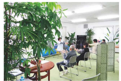
リラックスした中でのリハビリ

る利用者の状態に応じた質の高い機能訓練が可能。新しい事業なので、まず見て体験してもらうことに力を入れました。対象地域への利用のお知らせや体験会の実施など、最初の半年は本当に大変でした。乗り越えられたのはスタッフのおかげです。