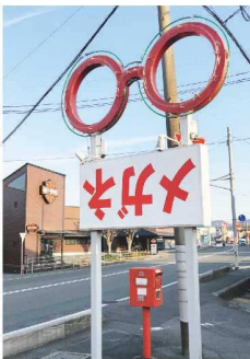
道路沿いの逆さメガネの看板

昭和41年に道場門前商店街で開業しました。平成4年に2号店となる大内店をオープン。昨年、51年間営業した道場門前店を閉店し、大内店と統合しました。お店の目印となっている「逆さメガネの看板」は、なぜ？と理由を聞かれることが多いのですが、メガネが必要な人はもちろん、そうでない人まで多くのお客様に当店を知っていただきたいとの想いで設置したものです。気になってわざわざ理由を聞きに来店されるお客様もいらっしゃったり、お客様とのコミュニケーションツールのひとつになっています。