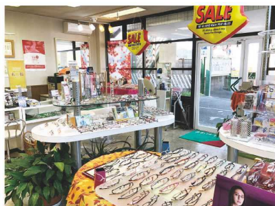
高品質な国産フレームを取り扱い

事業承継を進めていく中で、税制面でどのようなことに気を付けたらよいのか悩んでいたところ、商工会議所の月報で事業承継に関するチラシを見かけ相談をしました。専門家派遣制度の活