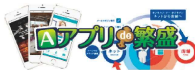
スマホ対応の販促アプリ

モバイル販売促進支援サービスとして、スマートフォンのアプリを活用した「アプリde繁盛」を展開しています。アプリde繁盛は、飲食業をはじめ、小売業、サービス業、医療介護業などさまざまな業種で活用いただけるシステムです。ポイント機能、クーポン機能、プッシュ通知機能などによるイベント情報発信、来店管理などお客様にダイレクトに情報発信ができ、リピーター客などを作るシステムとして、多くの企業様にご利用いただいています。