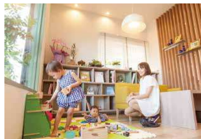
子供と一緒に大丈夫

れました。笑顔・発声・立ち方など技術以外に求められるレベルが高く、上下関係も厳しい、まさに体育会系でした。余りの辛さに転職も考えた時期もありましたが、どんな仕事も厳しく、やりたい事であれば体力的に辛くても頑張れると思ひ、やっぱり自分には美容しかないと感じが決められました。