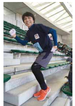
起業仲間と6時間リレーに参加

若い人に辛い修行期間も楽しいと感じて欲しいですし、山口に熱い思いを持った美容師が増えるよう、将来的には育成にも力を入れていきたいと思っています。