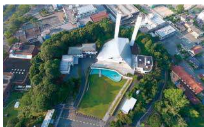
サビエル記念聖堂周辺を上空から

現在所有している3機種6台のドローンを撮影条件に応じて選定をし、パイロットも2名体制で「安全第一」をモットーに、高品質な画像を提供することに努めています。飛行にあたっては、規制があり通常は飛行場所ごとの申請が必要となっていますが、弊社は全国を飛行エリアとした1年間の飛行許可承認を国土交通省から取得しているため急な