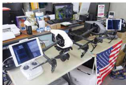
高性能のドローン

ドローン事業の認知度アップ及び販路開拓について、何か活用できるものはないかと思い、商工会議所職員の方に相談したところ、小規模事業者持続化補助金※の申請を勧められました。事業計画作成時には、専門家派遣制度も活用し、中小企業