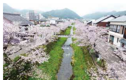
一の坂川を上空から

スタートしたばかりのドローン事業ですが、今後は弊社のメイン事業となるように成長させたいと考えています。現在はプロモーション撮影が主ですが、将来的には産業分野での高所の監視・点検、各種