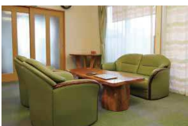
落ち着いた雰囲気の事務所

※小規模事業者持続化補助金とは、小規模事業者が経営計画に基づいて実施する販路開拓等の取り組みに対し、原則50万円を上限に補助金(補助率：2/3)が受けられるものです。