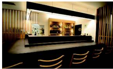
和食レストラン「いちりき」