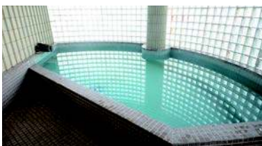
自家源泉の大浴場

当ホテルは、湯田温泉の中でも数少ない自家源泉「うへの泉」を単独で所有している温泉大浴場のあるビジネスホテルです。自家源泉の湯は、温泉泉質52度の源泉で、単純アルカリ泉、メタケイ酸を含み、美肌効果のある湯とも言われています。