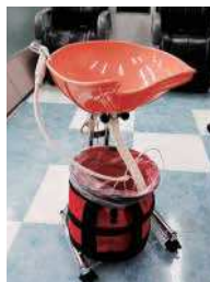
訪問美容事業で使用するポータブルシャンプー台

平成28年4月から新事業として訪問美容事業を開始しました。これは、来店が困難な高齢者や入院者、介護施設等の入所者への訪問施術サービスです。高齢者の入院や施設入所が増えている