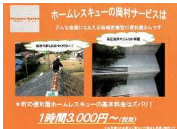
チラシもオレンジ

事業は、町の便利屋ホームレスキューとして、どんな依頼にも応える地域密着型サービスを行っています。こだわったのは、1時間3,000円(税別)と分かりやすい料金体系にすることです。また、何でも屋なので、事業所名でイメージが固まらないように「岡村サービス」にし、更に親しみやすさを感じて貰うために、企業カラーを山口カラーのオレンジにしました。このオレンジはとても目立つので、「あのオレンジの」とお客様に覚えて貰う際に役立っています。