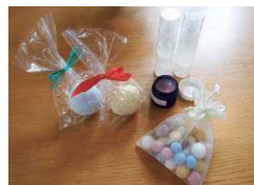
アロマを活かして作れる数々

これからはサロンでのトリートメント以外に、出張講座や、バスボムや美容ジェルなどのグッズを作成するクラフトなど、色々なメニュー展開をしていく予定です。アロマをもっと身近に感じて貰えると嬉しいです。