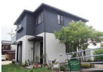
2号線の道路沿いのサロン

また、現在月1回ボランティアで特養老人ホーム梅光苑に行っていますが、最初は意を決した突撃訪問で、開業前の私を受け入れていただいた苑長には感謝しています。毎回トリートメント後は皆さん活き活きなさっておられる様子ですし、その笑顔で私の方が元気を貰っています。