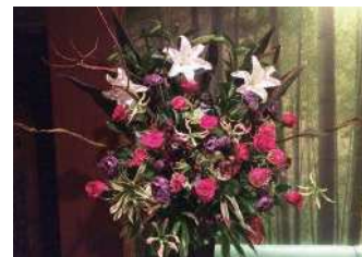
アレンジメントの一例

3つ目の夢は、一緒に働く従業員が、快適に働くことが出来る環境を作り、企業として発展していくことです。独立した直後は、自分一人でも何でもこなしていましたが、一人で出来ることには限界があります。そこで、勤務時代にはわからなかった、従業員の大切さに気づきました。自分で出来る仕事でも従業員に任せて成長を図ること、