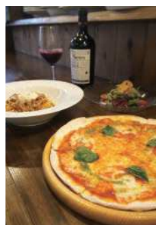
こだわりのピザとパスタ

オープンは、2011年3月15日でしたが、本当は3月11日の予定でした。開店準備に追われる最中に東北震災があり、日程を変更しましたので、とても静かなスタートとなりました。不安な時期もありましたが、家族の理解と協力・励ましもあって、今年で5年目を迎えることができました。お客様も口コミで徐々に広がり、リピーターも増えました。ランチを食べた奥様が、後日旦那様とご来店されると、とても嬉しいですね。