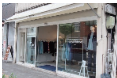
白を基調とした店舗

店舗は、白を基調として商品を引き立てるようにしています。また、初めての方も入りやすいように、外から店内の様子が分かるよ