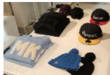
服以外の小物も充実

て、ファッションにかける費用が少なくなるのも避けられません。そのため、メンズだけでなくユニセックスの商品の取扱いや、女性用の小物の販売をスタートしました。女性に客層を広げることで、男性顧客拡大への相乗効果を期待しています。