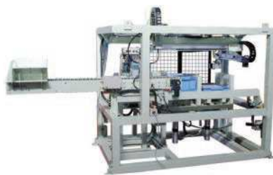
製品の洗浄・乾燥等のブロー～箱詰装置

当社は、昭和61年に創造技術で地場産業に貢献することを目的に、小郡（新山口駅前）で機械設計会社「有限会社技研」として設立しました。その後、平成9年に現在の場所大内に移転し、社名を「有限会社リンクス」に改名。社名には、経営方針でもある「鎖の如く強い絆・共生」といった意味が込められています。創業時は、メーカーからの受託開発、設計が主でしたが、現在では、製造現場での自動化設備の開発、設計、製作、据え付け、保守点検及びそれに係る物品までを県内のパートナー企業との連携により一貫して手掛けています。三菱重工業(株)、宇部興産(株)、(株)ブリヂストン、(株)長府製作所など大手企業とも取引をさせて頂いています。