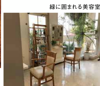
緑に囲まれる美容室