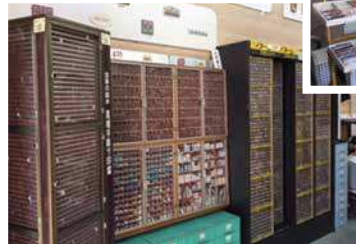
豊富な品揃えの中から、あなたにぴったりのご印鑑をお作りいたします。

永年山口市で、印章専門店として営業を行っています。親子三代あるいは、会社設立当初から・・・というお馴染みのお客様が多くおられます。