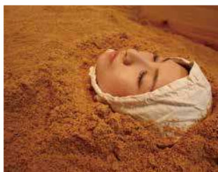
酵素温浴でデトックス&体温UP

これからもお客様により喜んでいただくとともに、成長していく美容室でありたいと思っております。