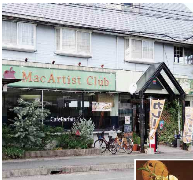
お店はMacの看板が目印。

平成7年、山口大学のテニスコート前にオープン。地元生産者の方の新鮮で丹精込められた野菜を使った日替わりランチ(700円税込み)や手作りカレー、鉄板オムライスなどは値段もリーズナブルで、お昼時には、一般の方や学生さんに人気をいただいております。また、パフェは、常時20種類を揃え、四季に合わせた限定パフェも4～5種類程度ご用意しております。毎月1回、全種類のパフェが半額となる「パフェの日」もお楽しみ下さい。