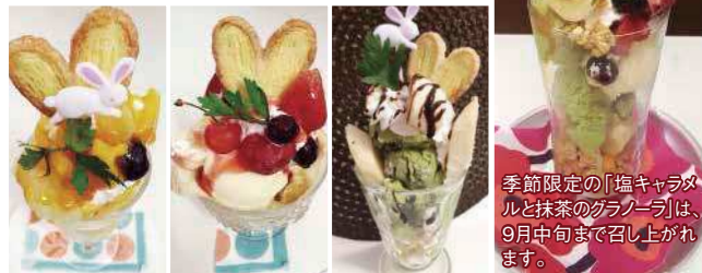
季節限定の「塩キャラメルと抹茶のグラクラー」は、9月中旬まで召し上がれます。

当店人気の「お茶べり会」は、女子会やご家族などグループで3名様以上でお越しいただくと、パフェとドリンクを合わせた料金が650円となっております。さらに、毎週水曜日は、500円で提供いたしております。「おいしい」ひとときをゆっくりお過ごし下さい。