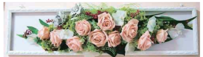
当社は、国産プリザーブドフラワー溶液にこだわることで、一般的に弱いとされる湿度や温度変化にも順応し、四季に応じた色や高度の変化を楽しむこともできます。

最近様々なところで見かける「プリザーブドフラワー」の魅力、ご存知ですか？プリザーブドフラワーは、生花から灰汁(脱水・脱色)を抜いて、プリザーブド溶液を吸わせることで、腐ったり枯れたりすることなく、生花本来の風合いやしなやかさ、瑞々しさを数年間保つことができます。