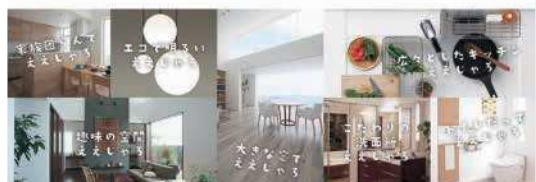
シミズホームのホームページ( http://shimizu-home.com/ )、ブログ・facebookも随時更新中! こちらもよろしくお願いいたします!