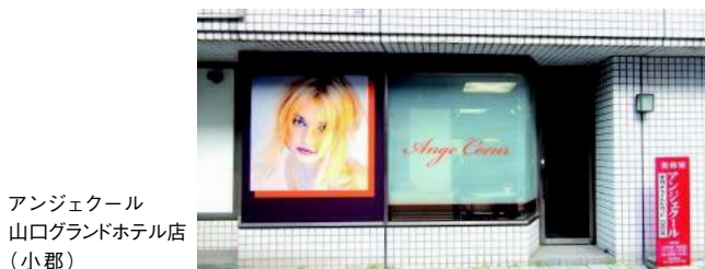
アンジェール山口グランドホテル店(小郡)