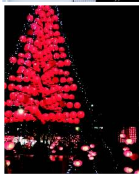
山口七塔ちようちんまつり、日本のクリスマス事業で、山口の灯りのお手伝いもしています。