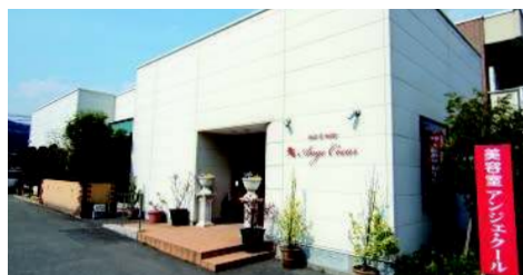
アンジェール新山口北口店(小郡)