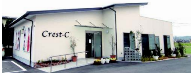
Crest-Cは、平成27年2月に深溝店を移転オープンしました。各店スタッフは、ほとんどがスタイリスト!元気で親切に対応し、アットホームなファミリーサロンでもてなし致します。

山口市、宇部市に6店舗、従業員30名の美容室を営んでおります。お陰様で、昨年創業50年を迎えました。地域に根ざし、長いおつきあいを頂ける店になることがモットーです。親子2世代、3世代のおつきあいを頂いているお客様が多く、初めてお越し頂くお客様にも、同様の対応、サービスの充実を心がけております。お客様の嬉しい笑顔が大好きで、きれいになって頂くデザインやクリニックケア、パーソナルビューティーなどメニューをご提案いたします。トリートメントサービスでは、地域他店で扱っていないヘアケア薬剤でトリートメントを行っており、白髪、抜け毛に効果が上がるヘッドスパも好評を頂いております。他に、アイエステやブライダルでのご利用もお待ちしております。HPに新規来店者向け割引券、ヘッドスパ半額割引券を掲載しておりますので、ご活用下さい。