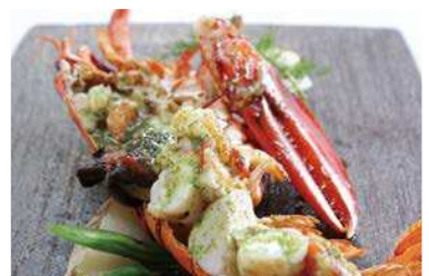
記念日のお客様に人気の アニバーサリーコース メイン活オマールエビのロースト