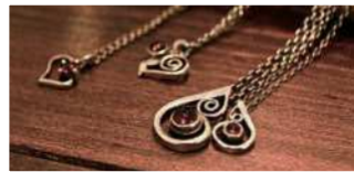
作り手、選んだ人、使う人...それぞれの想いが込められたお守りのような手作りアクセサリー。