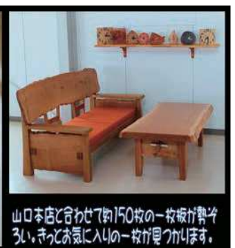
山口本店と合わせて約150枚の一枚板が貯けずい。きっとお気に入りの一枚が見つかります。