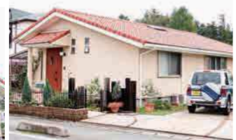
市内のリフォーム工事施工実績